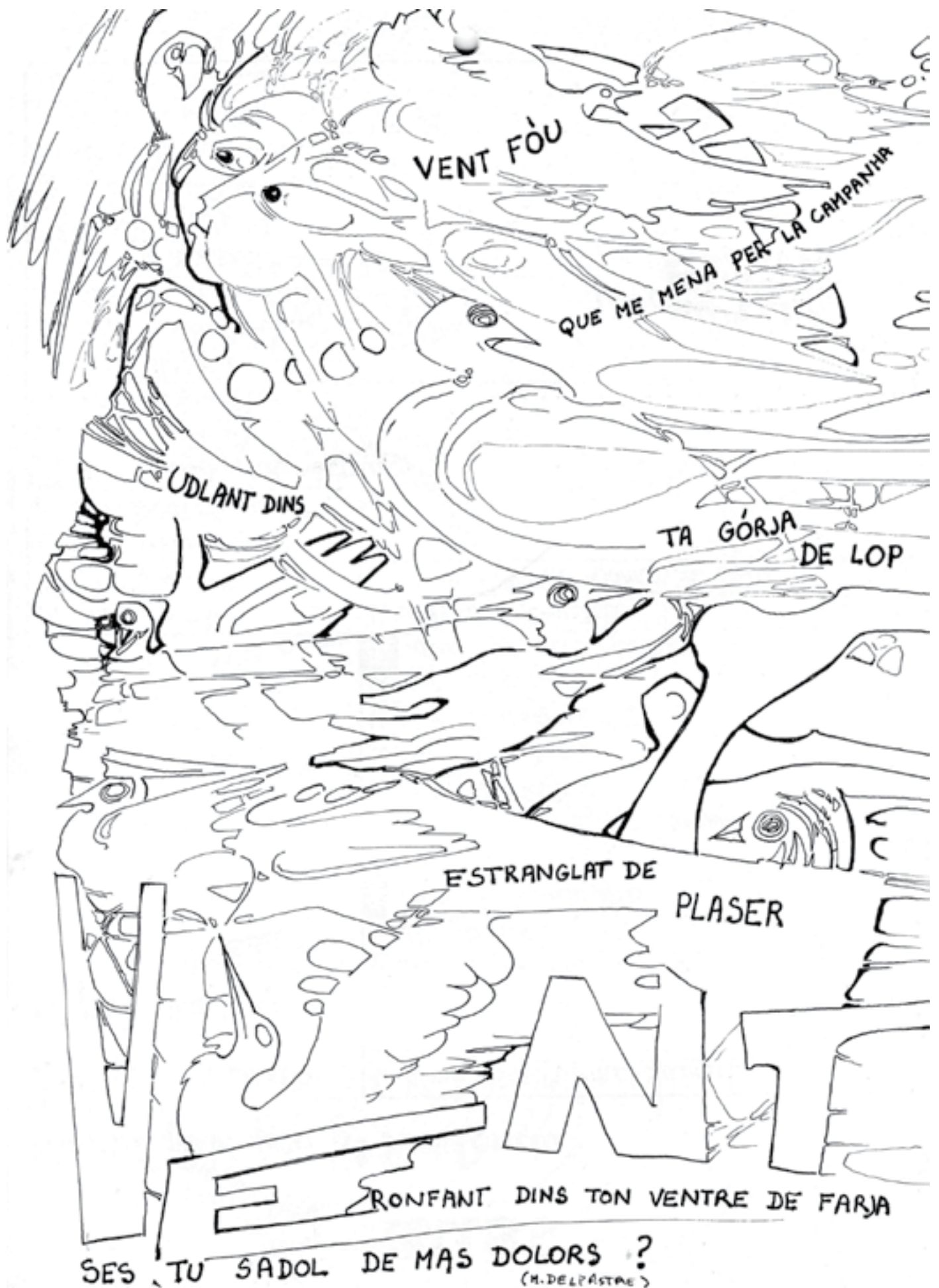
Calendrier Ôc-Segur de 1978, de la revista del mesme nom publicada a la fins de las annadas 70 per la Seccion Regionala Lemosina de l'IEO, amb dessenshs de J-M Simeonin e tèxtes de Delpastre.