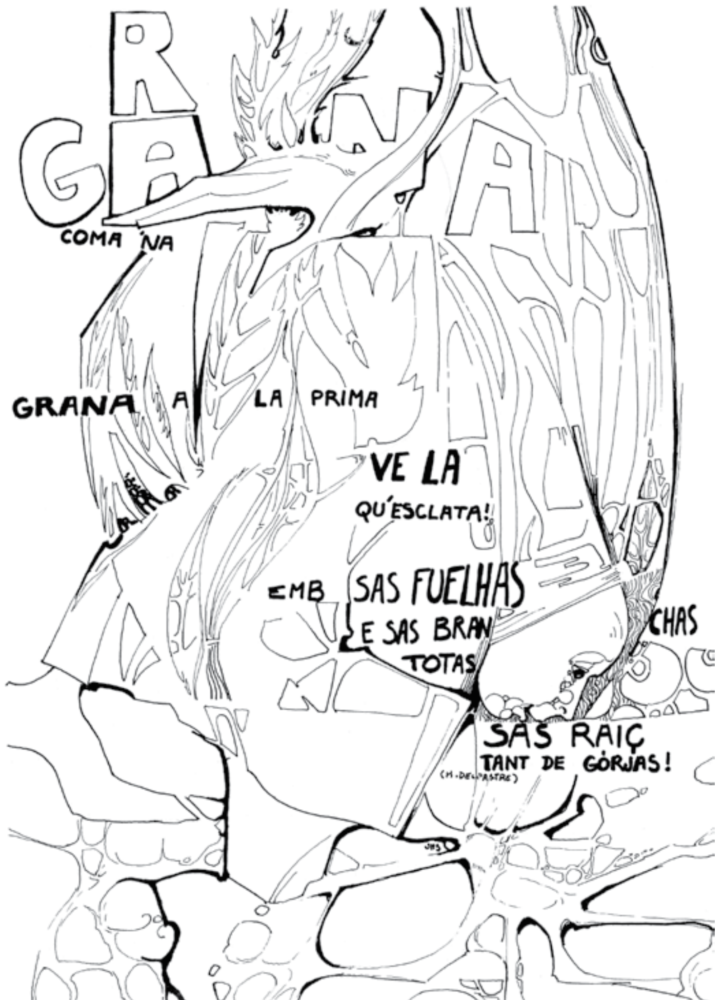
Calendrier Ôc-Segur de 1978, de la revista del mesme nom publicada a la fins de las annadas 70 per la Seccion Regionala Lemosina de l'IEO, amb dessenh de J-M Simeonin e tèxtes de Delpastre.