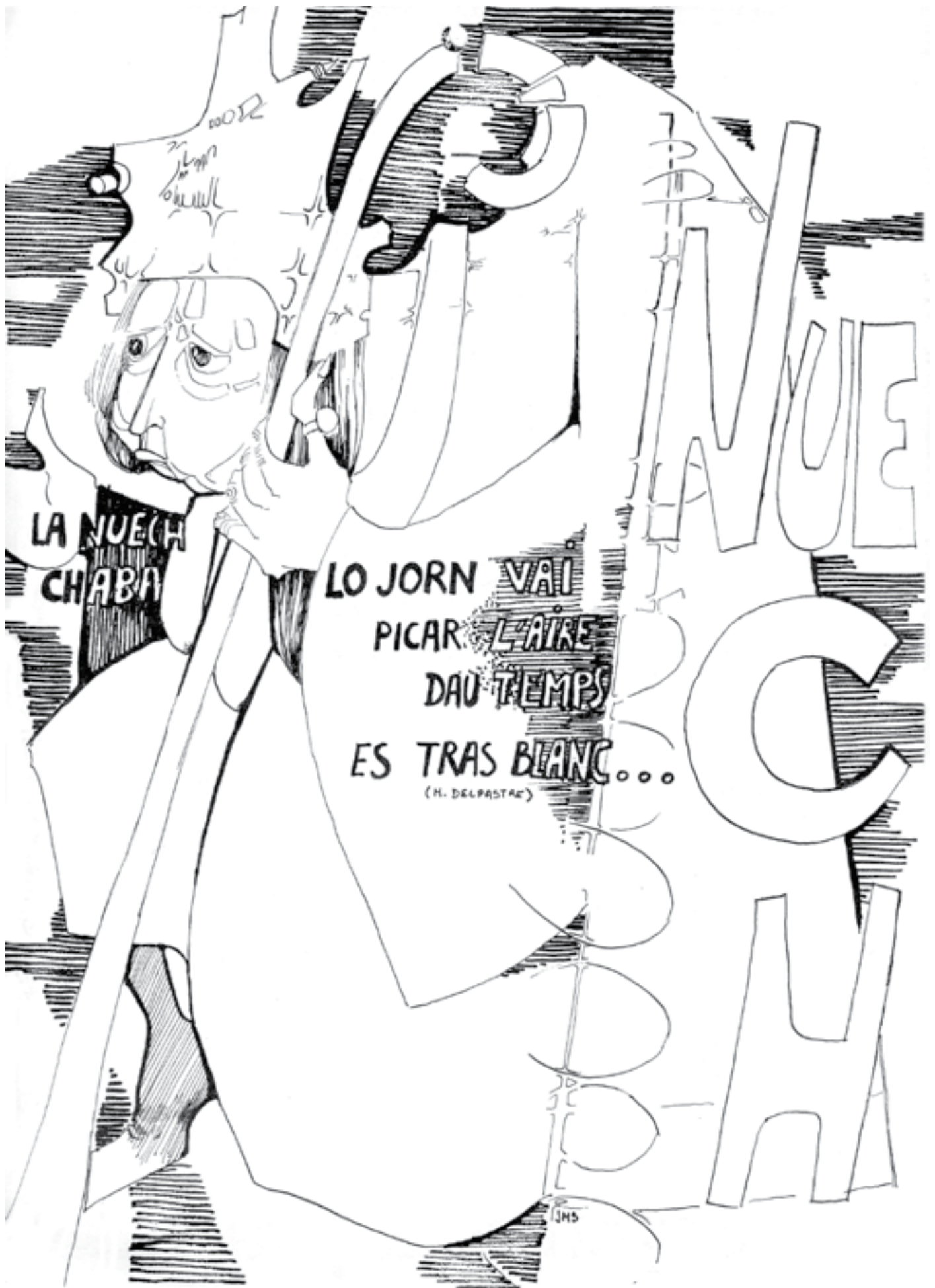
Calendrier Ôc-Segur de 1978, de la revista del mesme nom publicada a la fins de las annadas 70 per la Seccion Regionala Lemosina de l'IEO, amb dessenh de J-M Simeonin e tèxtes de Delpastre.