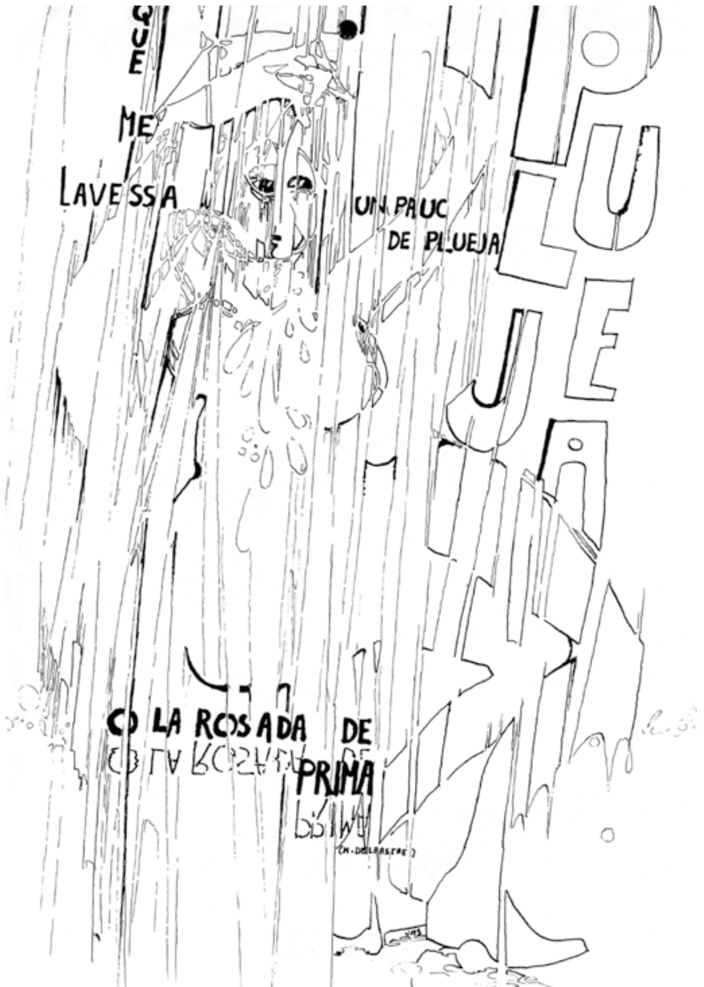
Calendrier Ôc-Segur de 1978, de la revista del mesmo nom publicada a la fins de las annadas 70 per la Seccion Regionala Lemosina de l'IEO, amb dessenshs de J-M Simeonin e tèxtes de Delpastre.